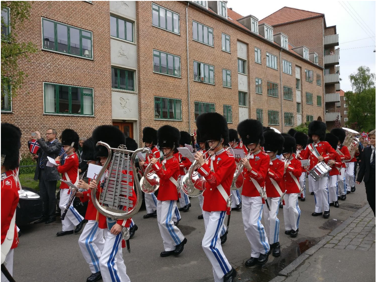
Tivoligarden trak op i anledning af Norges Nationaldag, 17. maj 2017