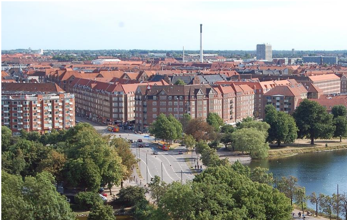
Christmas Møllers Plads, foto ca. 2006

Christmas Møllers Plads er "Porten til Amager", hvorfra Torvegade fra Christianshavn går ud på øen mod øst; Vermlandsgade, syd; Amagerbrogade, sydvest; Amagerfælledvej og vest; Ved Stadsgraven.