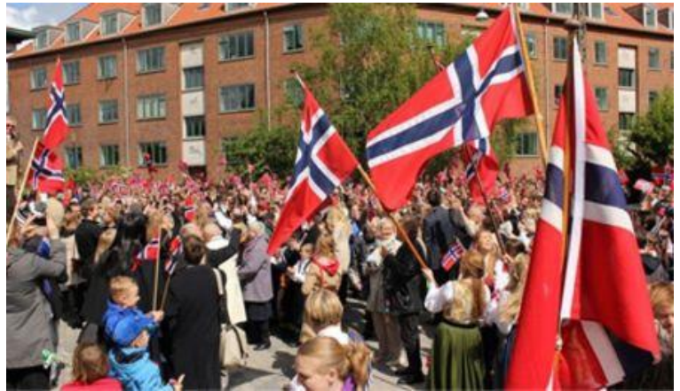
Foto 17. maj 2014

På Norges nationaldag, 17. maj, mødes op imod et par tusinde herboende nordmænd. Mange i deres flotte nationaldragter. De går i optog på det nærliggende voldterræn, og der festes i og omkring Kong Haakons Kirke. Kirken benævnes ofte blot som Den norske Kirke er tillige et norsk kulturcenter og bibliotek.