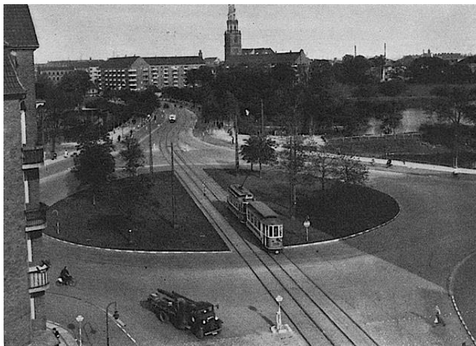
Rundkørsel blev anlagt i vinteren 1941-1942 *). Dengang Danmarks største.