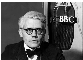
John Christmas Møller 1894-1948

På østsiden, hvor Vermlandsgade går i dag, lå indtil slutningen af 1930'erne forlystelsesstedet White Star . Det hed tidligere Vennelyst , og har givet navn til kolonihaverne, der nu ligger langs Kløvermarksvej.