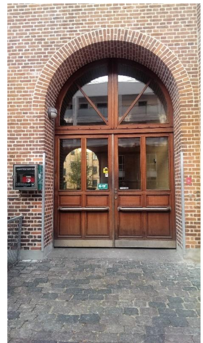
Porten fra 10 års jubilæet i 2009 Foto 2016