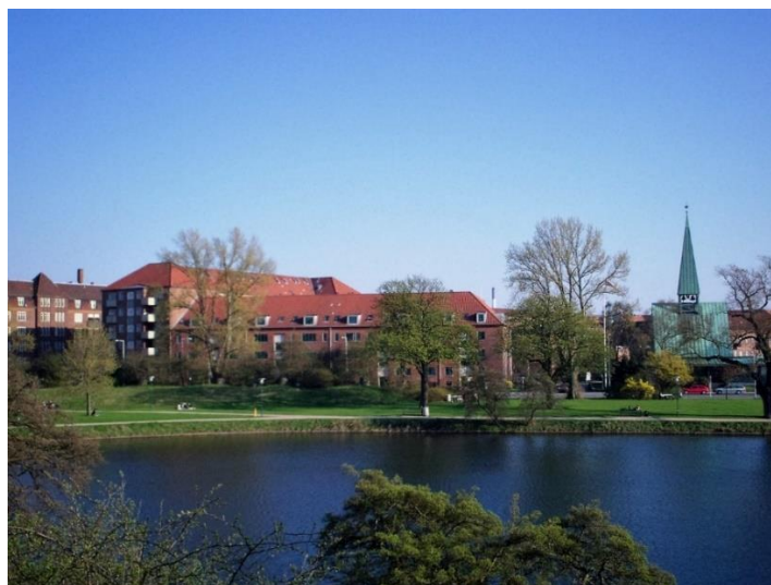
Facade mod Ved Stadsgraven, 2006

Den daværende lejerforening havde med erfaringerne fra 1993 stort set opgivet på forhånd, så initiativgruppen havde kun 17 dage til at få tegningsblanketter og aftaler i hus, samt afholdelse af en stiftende generalforsamling. Den blev holdt i Kong Haakons Kirke.