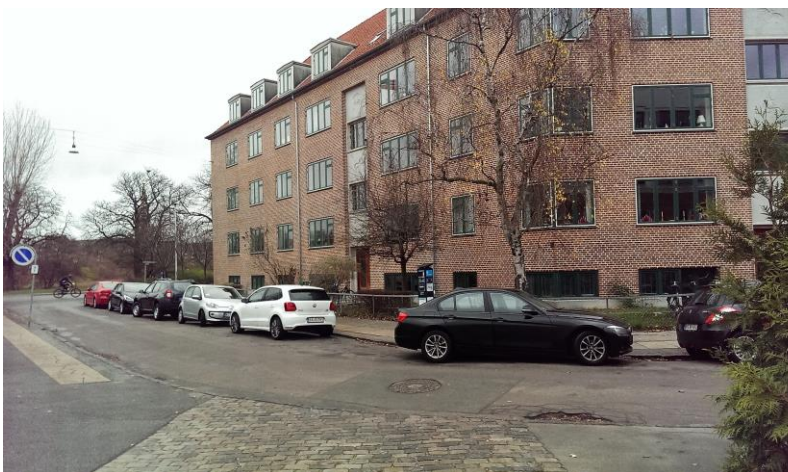
Facade Ved Mønten mod Ved Stadsgraven, 2016