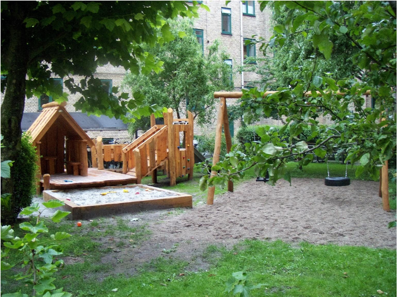
Gården – Ny "Lilleput by", 2011

Den nye legeplads i gården blev anlagt på initiativ af forældre til mindre børn i ejendommen. Tanken ved at tilgodese de mindste er, at større børn primært benytter Enveloppeparken til fodbold mv. og at den kommunalt bemandede legeplads på Christianshavns Vold, hvor legeredskaber og udfoldelsesmuligheder er større, ligger så tæt på os - umiddelbart over for ejendommen.