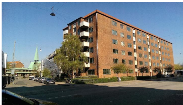
Facade mod Amagerfælledvej / Ved Mønten, 2016 (if. med facaderenoveringen)

Andelsforeningen ejer ejendommen matr. nr. 423 Amagerbro Kvarter, beliggende Ved Mønten 11 - 19, Ved Stadsgraven 1 - 9 og Amager Fælledvej 4 - 8, 2300 København S. Ejendommen der er fra 1935 er beliggende på Amager ved Christmas Møllers Plads. Taget er fra hhv. 1993 og 1996, de 640 IdealCombi døre og vinduer i aluminium/træ er fra 2004.