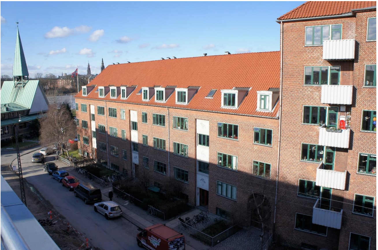
Facade mod Ved Mønten 2013

Vi disponerer over 130 lejligheder bestående af 28 forskellige lejlighedstyper fordelt på 1½-4 rums boliger på 56-136 m 2 , med tilhørende loftsrums, enkelte med altan. Ejendommen er på hhv. 3 og 5 etager, med elevator i opgangene Ved Stadsgraven 1 og Ved Mønten 19. Herudover udlejes en række erhvervs- og kælderlejemål.