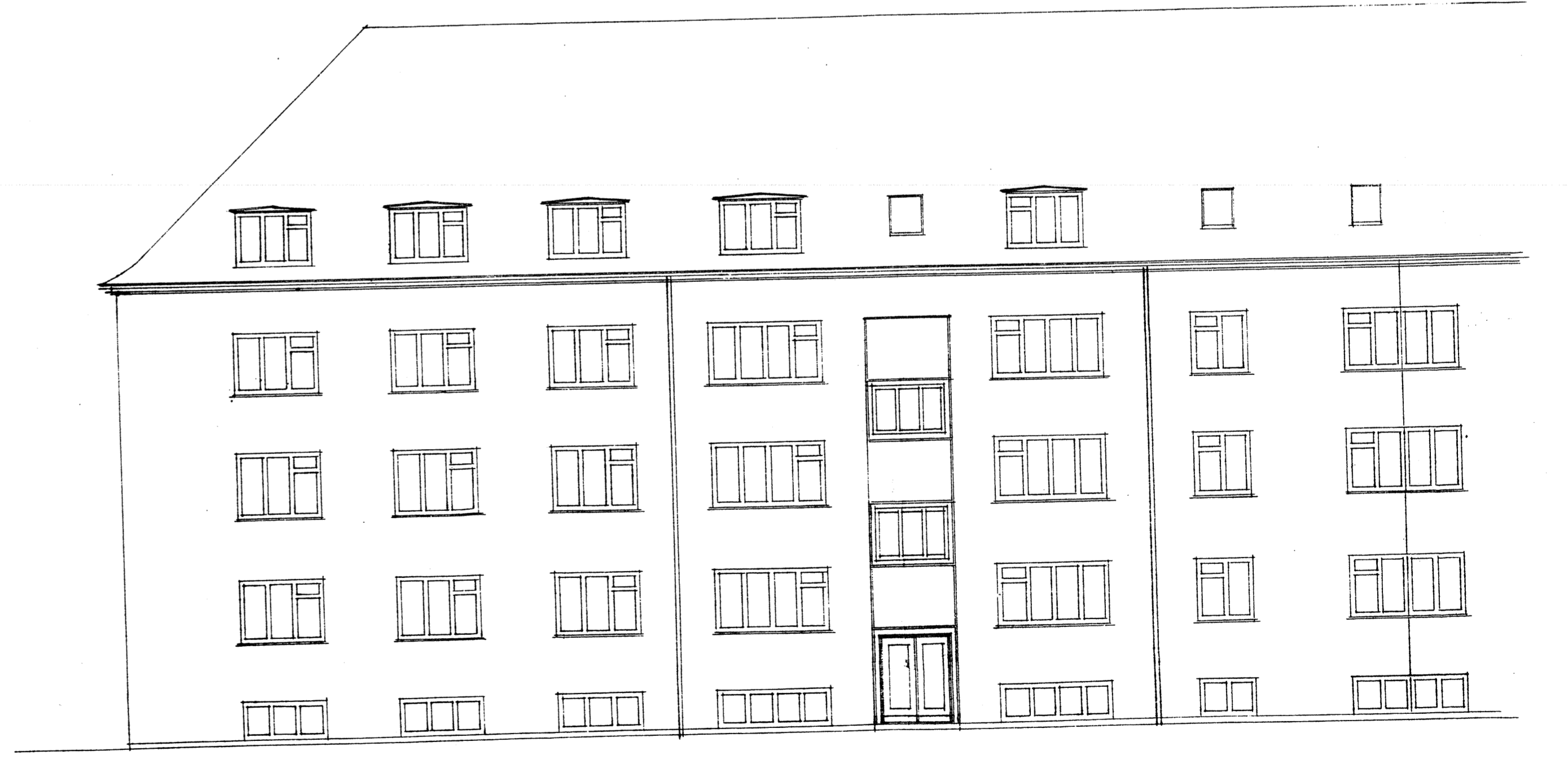
Facade mod Ved mønten.