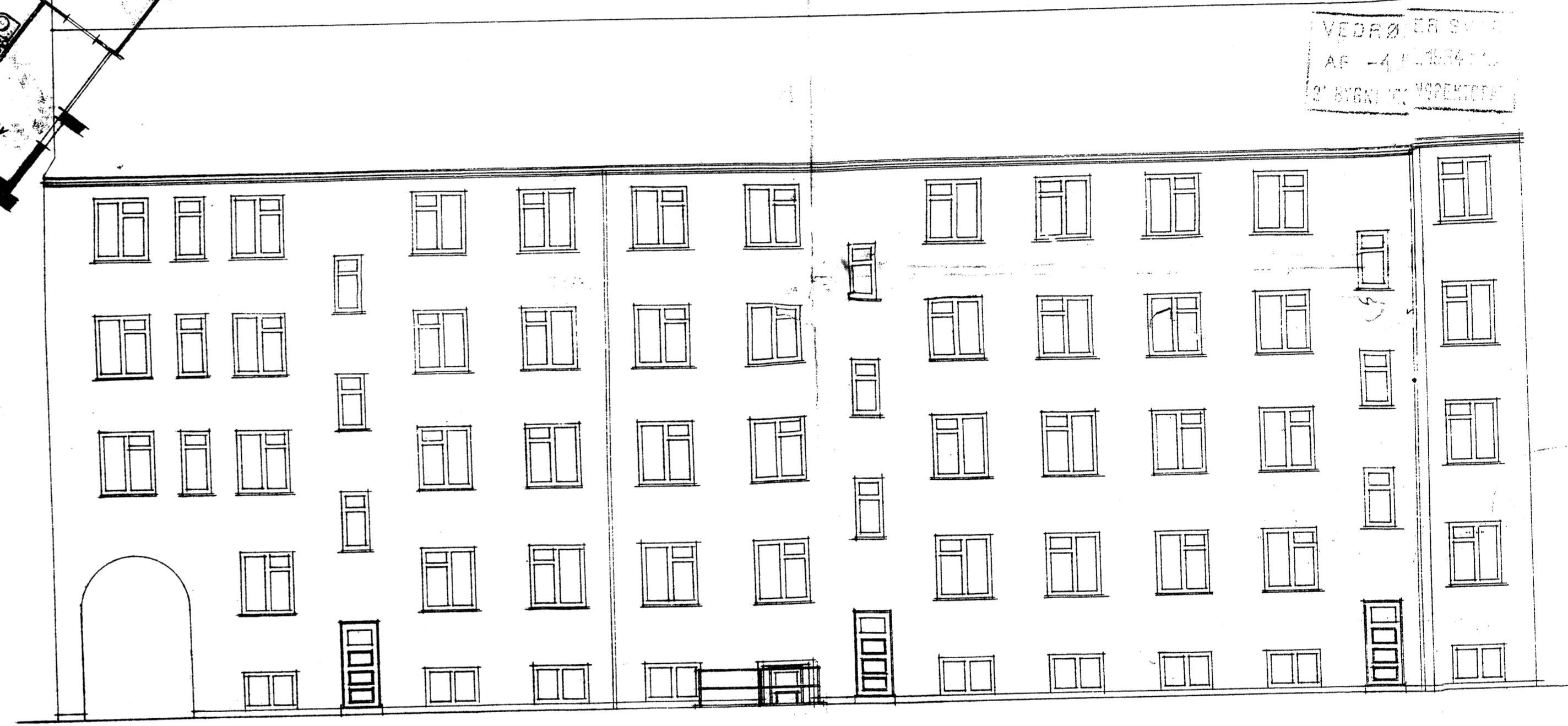
Parti af grundfacade.

Her indek er vist udførte Bjælkelag og vinduesbjælter som angivet på Etageplanerne.