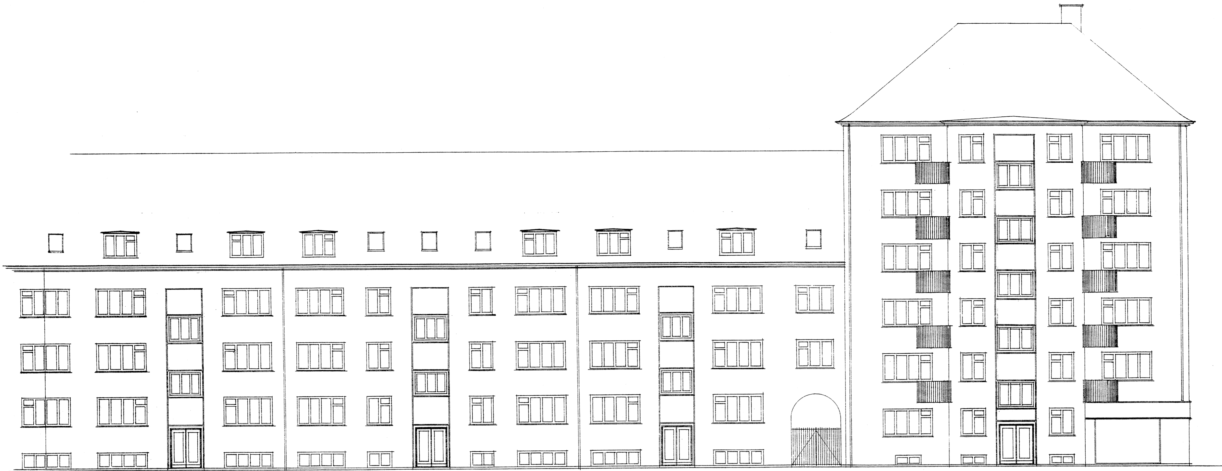
Facade mod Ved mønten

Ejendomsaktieselskabet "Ved mønten" 1 Beliggende paa matr. nr. 290 og 291, Amagerhøi, København, beliggende ved Tomtepladsvej, Ved mønten og Enveloppevej Facader 1:100.