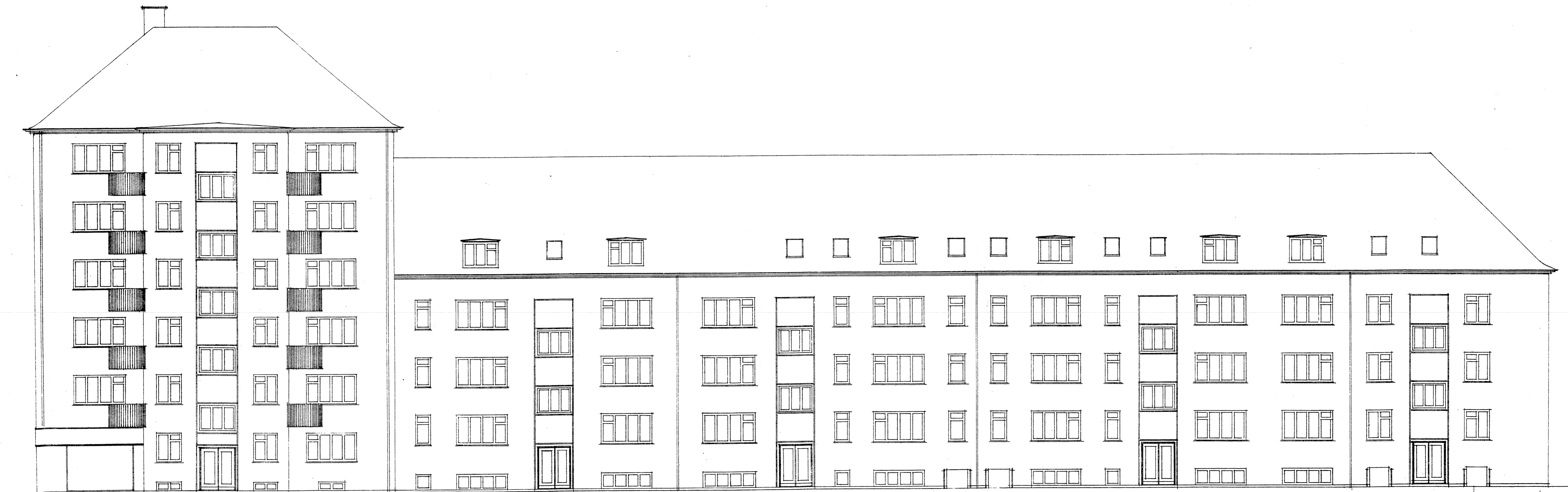
Facade mod Enveloppevej