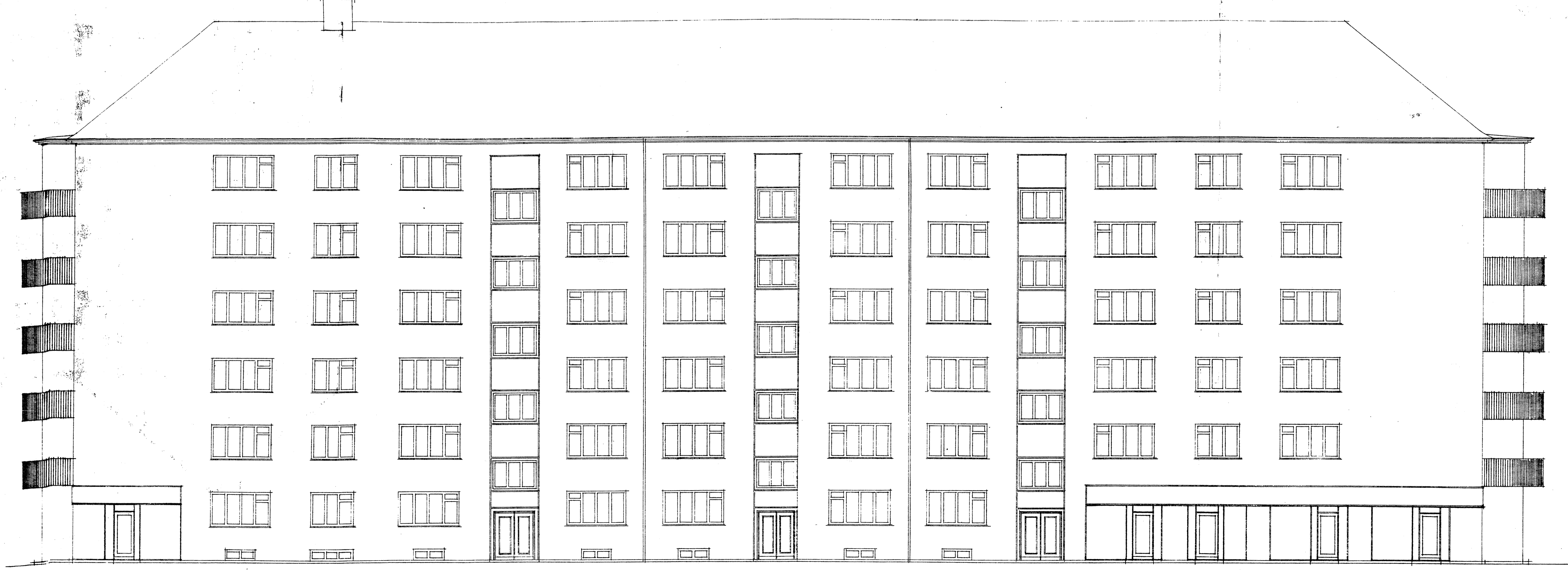
Facade mod Strømfælledvej.